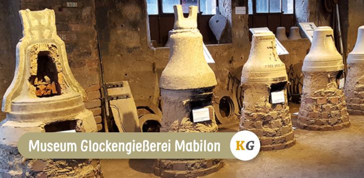
Museum Glockengießerei Mabilon KG