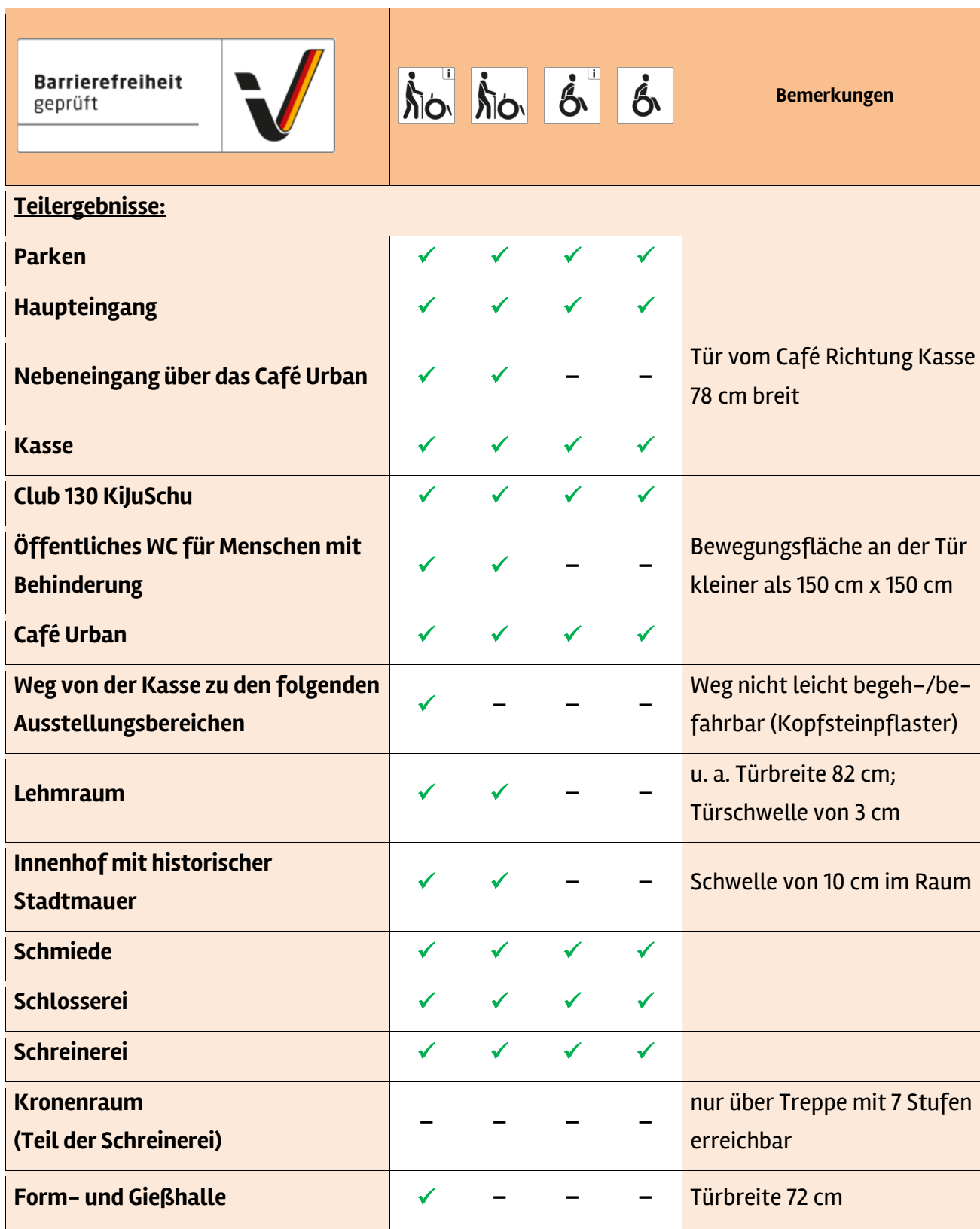
Tabelle 1: Überblick über das Prüfergebnis